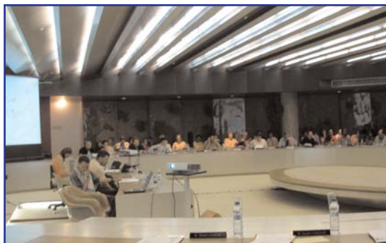
La salle des séances du Conseil général à Bobigny

« Les chiffres du RMI sont éloquentes. Notre département a franchi la barre des 50 000 allocataires en octobre dernier. Au risque de nous répéter, il est évident que la compensation ne correspond pas à la réalité des besoins. (...) Dans ce contexte, il faut souligner que le département a fait un effort significatif pour continuer à consacrer 17 % du montant des allocations versées à des actions d'insertion. Cet effort se retrouve également dans le fonds départemental d'aide aux jeunes, dont la pleine gestion est assurée par le département depuis le 1er janvier dernier. D'autres volets de l'action sociale méritent d'être soulignés - notamment ce qui a trait aux personnes handicapées, suite à l'adoption de la loi pour l'égalité des