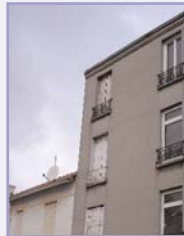
le 13 rue Trévet

La ville d'Aubervilliers a cédé un immeuble lui appartenant situé 13 rue Trévet pour la réalisation de logements transitoires très sociaux. Ce projet, fruit d'un travail partenarial entre la municipalité et les structures associatives permettra de mettre 4 logements à la disposition du réseau REALISE qui travaille en liaison avec les Restaurants du Cœur. Les logements seront destinés, pour des périodes allant de 6 mois à 2 ans, à des personnes en insertion employées par les Structures d'Insertion par l'Activité Economique et bénéficiant d'un accompagnement social.