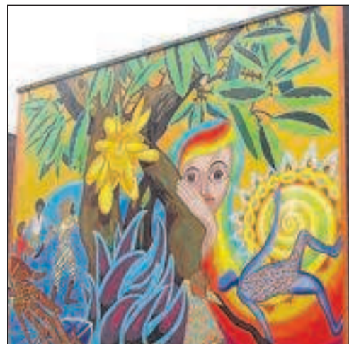
BONDY, MERCREDI. La fresque réalisée par des artistes américains a été inaugurée. (M.-P.B.)

ÇA Y EST, Bondy a sa fresque. Le mur de l'école primaire du quartier Terre-Saint-Blaise à Bondy-Nord l'aura attendue un peu plus longtemps que prévu. La fresque de 6 m sur 8 m, qui aurait dû être installée mi-août, a finalement été inaugurée mardi soir. « Ça valait le coup d'attendre ! » commente une riveraine après avoir découvert l'œuvre haute en couleur. « C'est un projet enchanteur », ajoute une autre. Le dessin à dominante orangées et fauves représente une jeune femme qui enlace un tronc d'arbre. Au premier plan, deux mains se rejoignent en signe de fraternité. Au fond, trois Noirs dansent. Un autre sommeille. « Ça illumine la place », commente un adolescent qui aime bien le graffiti. Le retard de livraison de la fresque commanditée par l'ambassade des États-Unis et le ministère des Affaires étrangères est dû à un problème technique. Les artistes américains venus de Philadelphie, les graffeurs de la ville, comme Batsch, et des enfants des centres de loisirs ont dû repousser l'accrochage de leur travail.