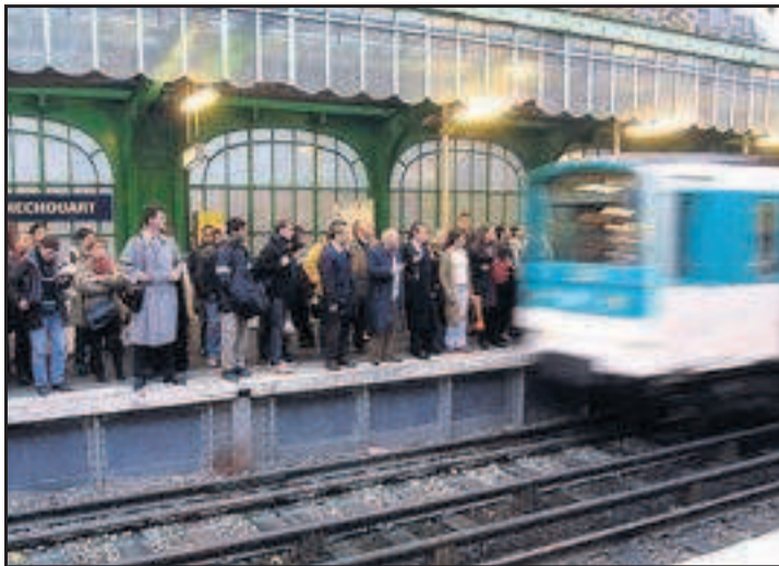
PARIS, LIGNE 2 DU METRO. Hier matin, trois rames ont connu des incidents de freinage, dépassant leur point d'arrêt en station de 2 m jusqu'à 20 m.

Ces couacs rappellent celui survenu jeudi dernier, lorsqu'un métro de la ligne 2 n'avait pas pu s'arrêter à la station Stalingrad. Et celui du même type, survenu à la Chapelle le 2 juillet... A chaque fois, ces dysfonctionnements impliquent les nouveaux trains de la ligne 2 (qui représentent au-