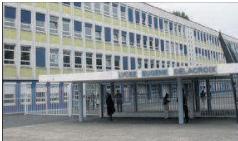
DRANCY, HIER. Classe sans professeur, deux cours en même temps... les grévistes dénoncent les nombreux dysfonctionnements au lycée Delacroix.