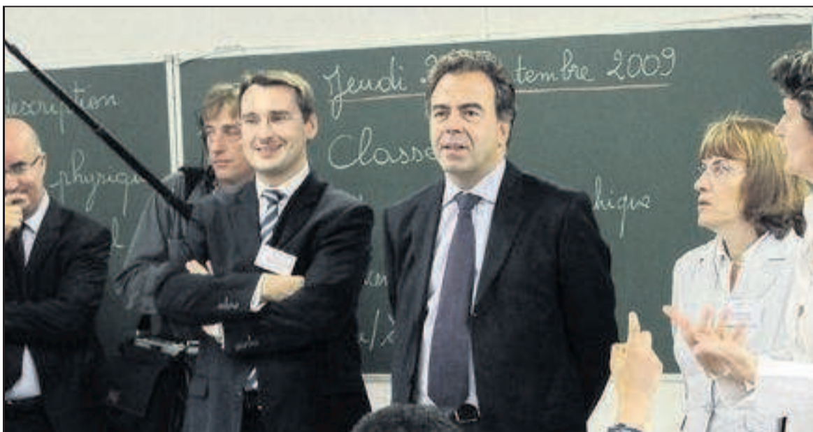
BONDY, HIER. Luc Chatel, ministre de l'Éducation, était en visite dans le groupe scolaire privé catholique de l'Assomption.