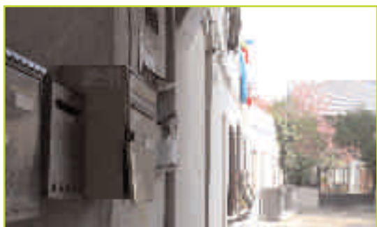
Aubervilliers, rue Charron Rénover et préserver le caractère du Centre - Ville

M algré les actions engagées depuis plusieurs années, le processus de dégradation de l'habitat du centre-ville n'a pu être enrayer. Les disparités sociales se sont accrues et l'état de nombreux immeubles nécessite une intervention massive de l'action publique. Devant