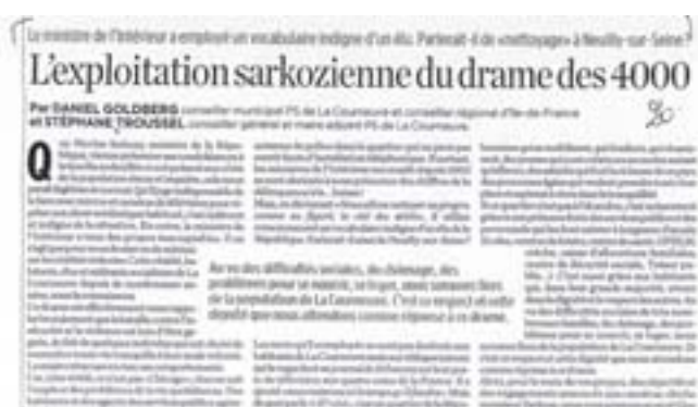
Tribune du 23 juin 2005 parue dans Libération

Je considère comme une faute politique d'avoir permis au Ministre de l'Intérieur de l'époque de faire plusieurs shows médiatiques dans la mairie de La Courneuve au point de mettre en titre du journal municipal « coup d'accélérateur aux dossiers locaux » et d'envoyer une lettre aux chômeurs de la commune se félicitant que la « volonté de réduire le chômage sur notre territoire a enfin été entendue ». La banlieue mérite mieux que d'être utilisée comme tête de gondole dans le supermarché d'une campagne électorale.