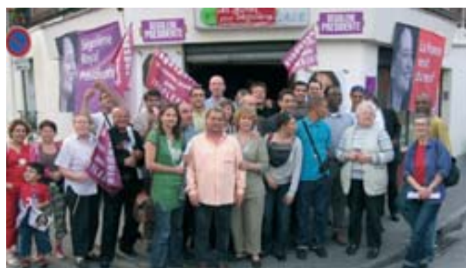
Avec le comité de soutien à Ségolène Royal à Aubervilliers

Aussi, quelles que soient les évolutions de la loi, je m'engage à ne pas cumuler mon mandat de député avec une fonction exécutive , dès le renouvellement des conseils municipaux.